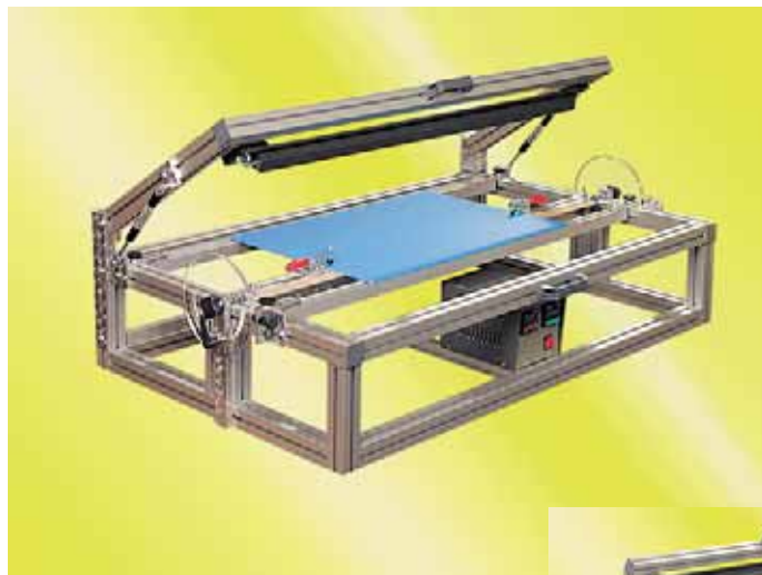
Typ: Keilus M 1000