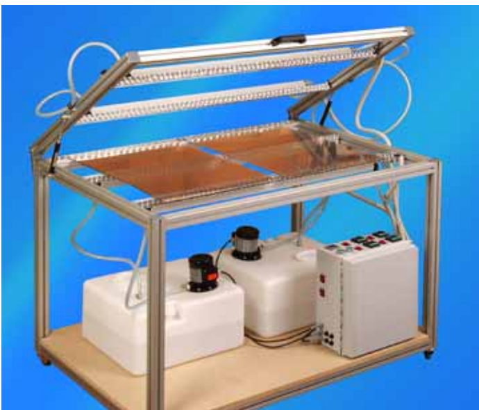
Bei dünneren Zuschnitten wird nur die Unterheizung aktiviert