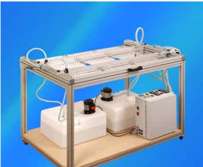
3 Nutzen in thermischer Behandlung